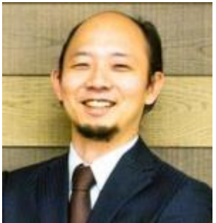
株式会社オウルズコンサルティンググループ 代表取締役CEO