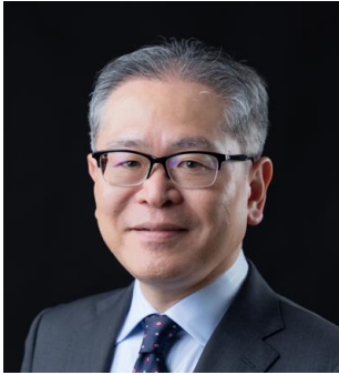
フライシュマン・ヒラード・ジャパン株式会社 代表取締役社長